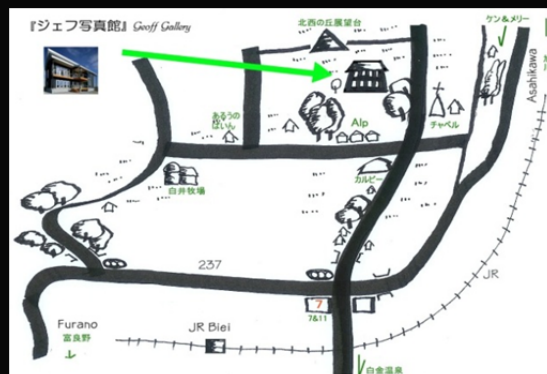
ギャラリー周辺図